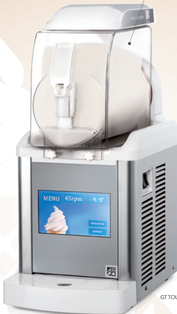
GT TOUCH 1